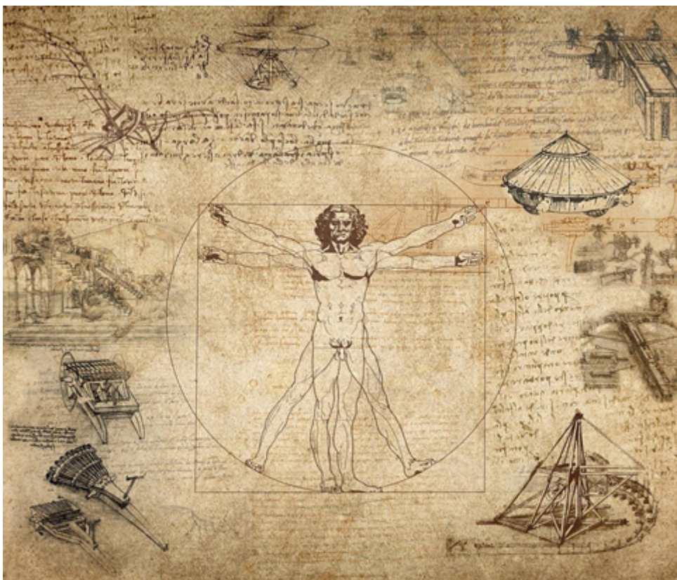
Homme de Vitruve (Leonard)

UNE ACTIVITE A LA FOIS VALORISEE ET FLOUE. La notion d'ingénierie est très valorisée en contexte professionnel dans l'espace francophone, notamment depuis le milieu du 20ème siècle. Se substituant au terme de génie, elle réussit la performance de susciter à la fois des connotations scientifiques/rationnelles ordonnées autour de la notion de 'progrès', et des connotations relatives à une approche globale, contextualisée, singulière de l'action.